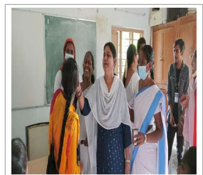
Students were given pills by Health Dept and Staff