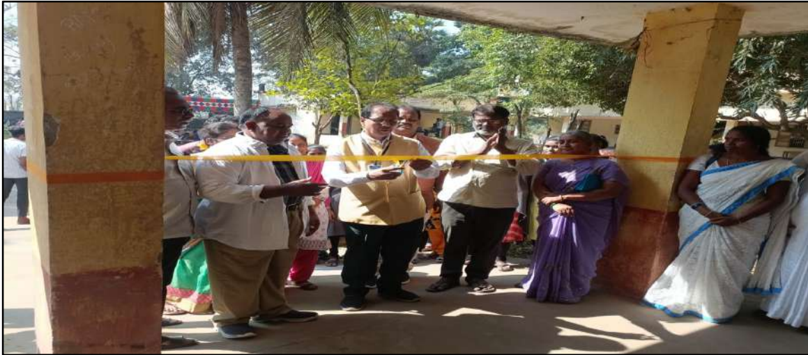
GENERAL MEDICAL CAMP INAUGURATION BY Dr.D.CHITTIBABU , PRINCIPAL GOVT.DEGREE COLLEGE,SEETHANAGARAM