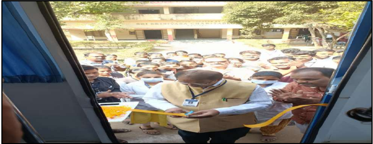
EYE MEDICAL CAMP INAUGURATION BY Dr.D.CHITTIBABU, PRINCIPAL GOVT.DEGREE COLLEGE,SEETHANAGARAM